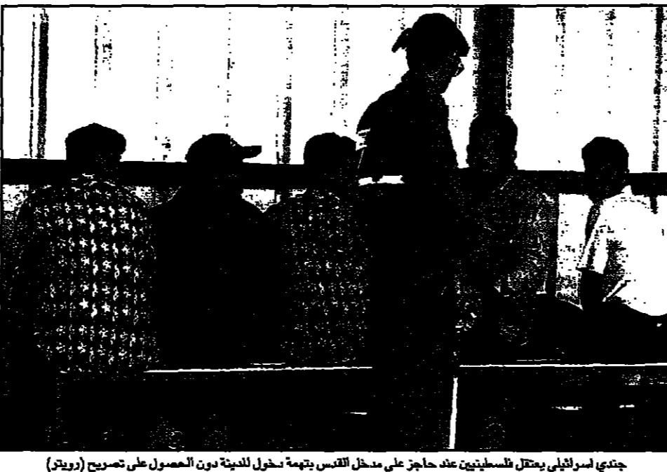
جندي اسرائيلي يعقل فلسطينيين عند حاجز على حافة الخليل (ديون)

الخليل - افيد ان سيارتين عسكريتين اسرئيليتين تجاوزا حاجز السيطرة الفلسطينية في المدينة. وقال وزير الدفاع، ان هذا التصرف يعد انتهاكا للقانون الدولي. كما افيد ان الجيش الاسرائيلي يعقل ثلاثة فلسطينيين ويعتدي على اخريين. وقال وزير الخارجية، ان هذا التصرف يعد انتهاكا للقانون الدولي.